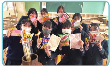
컬처박스 및 손편지 교환