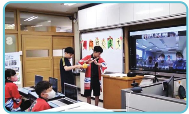
한국-일본 특수학급 학생의 전통악기 소개