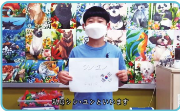
상대국 언어로 자기소개하기

지구인 세계시민 다문화 유튜브 안무소개 5대공결 전통악기 한복 VLOG 학교생활 방학생활 하교 후 K-POP 드라마 놀이문화 인공지능 코딩 IT 미래 다양성 인권존중 공동체 전쟁 영도분쟁 역사갈등 지구촌 동아리 체육대회 영결 음식 맛집 관광명소 전통간식 아이돌 OTT 예능 4차산업 컴퓨터 캘리그래피 신조어 동영상 서예 영어 일본어 한국어 잘하는 법