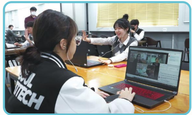
소규모 그룹 활동을 통한 수업 교류