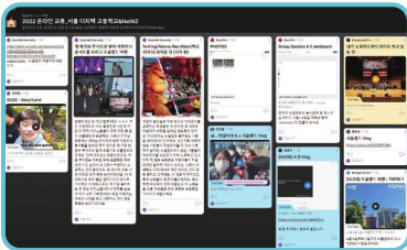
서로의 일상(V-LOG) 공유하기