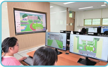
메타버스를 활용한 국제공동수업