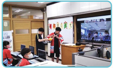
韓国と日本の特殊学級 生徒による伝統楽器の紹介