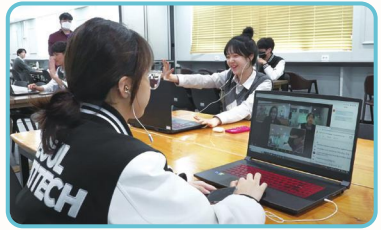
小人数のグループワークによる授業交流