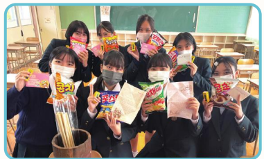
カルチャーボックス& 手書きの手紙のやり取り