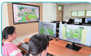
利用元宇宙的国际共同课程