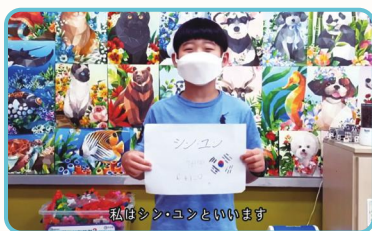
用对方国家的语言进行自我介绍