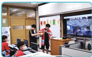
韩国-日本特殊班级 学生介绍传统乐器