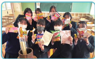
交换文化盒及手写信