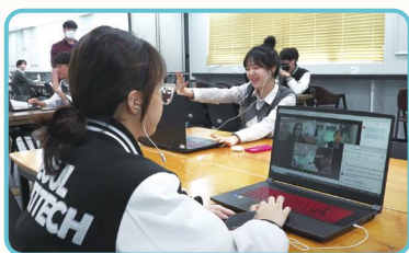
通过小组交流活动课程