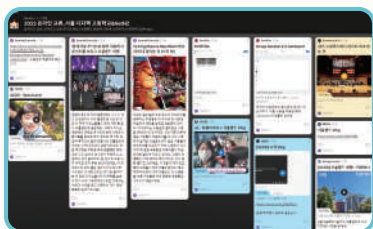
Partage du quotidien (VLOG) des uns avec les autres