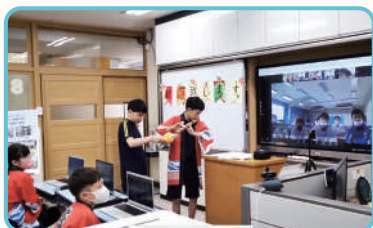
Présentation d'instruments de musique traditionnels par des élèves de classes spécialisées Corée-Japon