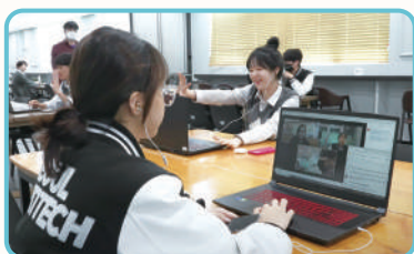
Échange de cours avec des activités en petits groupes