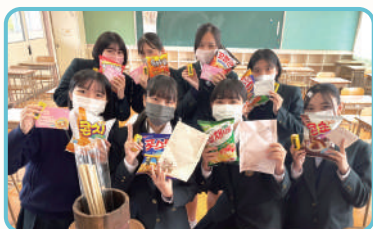
Échange de boîtes culturelles et de lettres manuscrites