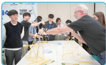
Atelier international d'enseignement sur l'application du codage pour les élèves de lycée Corée-Nouvelle-Zélande