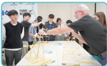
한국-뉴질랜드 고교생 코딩 활용 국제공동수업