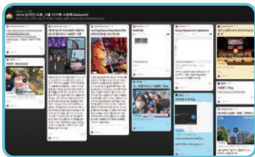
서로의 일상(V-LOG) 공유하기