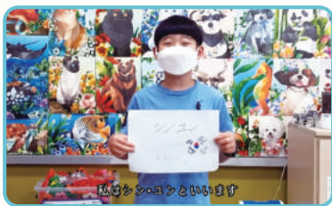
상대국 언어로 자기소개하기