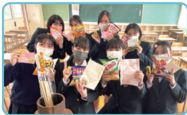
컬처박스 및 손편지 교환