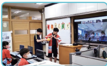
한국-일본 특수학급 학생의 전통악기 소개