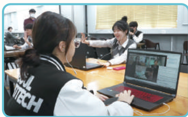
소규모 그룹 활동을 통한 수업 교류